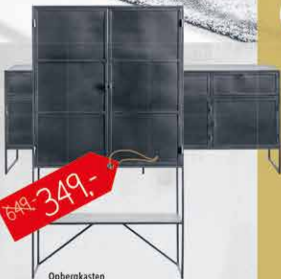
Opbergkasten woonprogramma Orizone Uitgevoerd in zwart metaal, verkrijgbaar in verschillende uitvoeringen.

PROFITEER NU TOT 70% KORTING OP ONZE SHOWROOM MODELLEN MEUBELS, ACCESSOIRES EN VERLICHTING