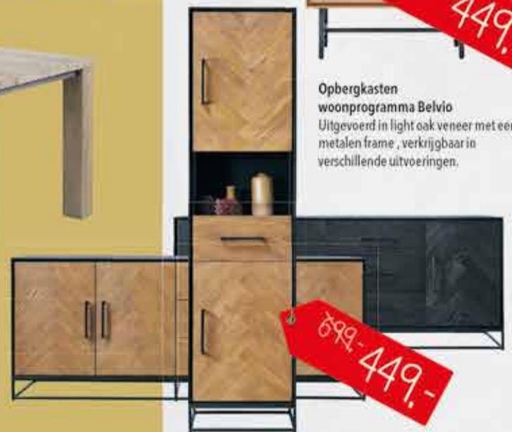
Opbergkasten woonprogramma Belvio Uitgevoerd in light oak veneer met een metalen frame, verkrijgbaar in verschillende uitvoeringen.