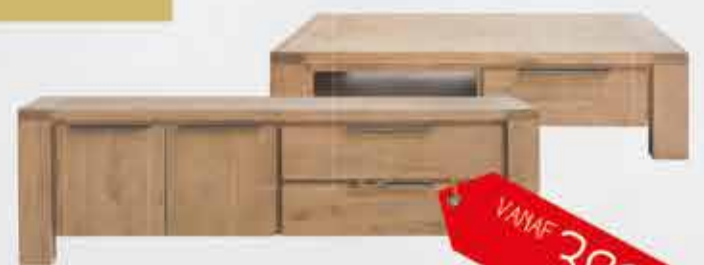
Opbergkasten woonprogramma Veneta Uitgevoerd met deuren en laden in eiken fineer met visgraat motief, verkrijgbaar in verschillende uitvoeringen.