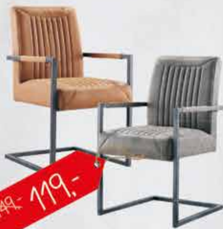
Armstoel Parantino Uitgevoerd met pocketvering verkrijgbaar in verschillende kleuren.