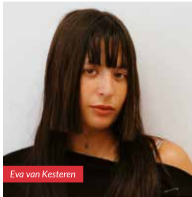
Eva van Kesteren

In Amsterdam groeide de Molukse gemeenschap op zonder eigen wijk, maar met een gedeeld verleden van ontheemding en strijd om erkenning. Nu staat een andere generatie op: jong, creatief en toekomstgericht. Fotograaf Eva van Kesteren laat zien hoe Molukse Amsterdammers vandaag hun identiteit vormgeven; geworteld in hun geschiedenis, maar met de blik vooruit.