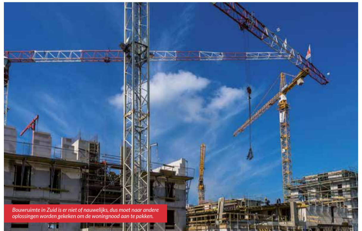
Bouwruimte in Zuid is er niet of nauwelijks, dus moet naar andere oplossingen worden gekeken om de woningnood aan te pakken.

Er is geen panklare oplossing, maar alle beetjes helpen. Daar waren de vertegenwoordiging van het stadsdeel en een dertigtal bewoners van Zuid het wel over eens bij het wooncafé, 22 mei in Huis van de Wijk Rivierenbuurt. Onderwerp van gesprek: sociale huur in Zuid. Maar tijdens de bijna drie uur durende bijeenkomst kwam er nog veel meer aan bod.