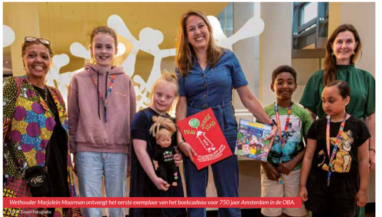
Wethouder Marjolein Moorman ontvangt het eerste exemplaar van het boekcadeau voor 750 jaar Amsterdam in de OBA.

Alle 60.000 basisschoolleerlingen in Amsterdam ontvangen een jubileumboek over het 750-jarige bestaan van Amsterdam. Wethouder Marjolein Moorman (onder andere Onderwijs) nam halverwege mei in de OBA symbolisch het eerste boek in ontvangst.