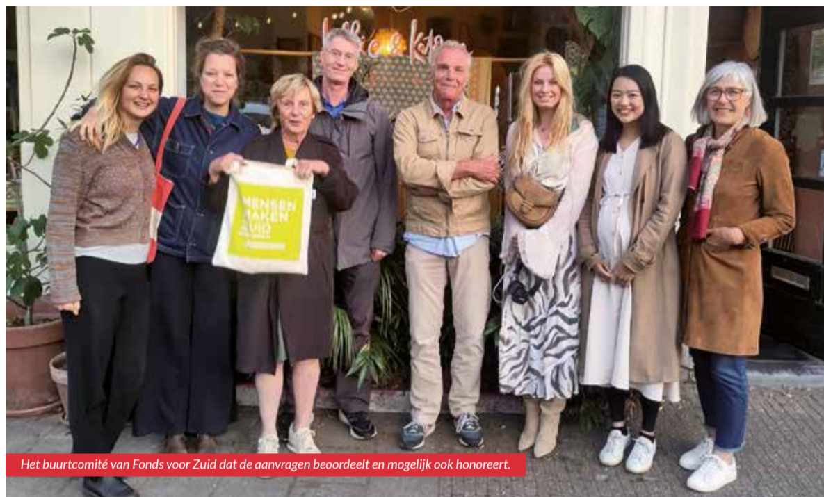
Het buurtcomité van Fonds voor Zuid dat de aanvragen beoordeelt en mogelijk ook honoreert.

Verbinding, het verbeteren van contacten tussen bewoners door middel van activiteiten als festivals, buurtborrels of andersoortige bijeenkomsten. Met dank aan de financiële ondersteuning van bijvoorbeeld Fonds voor Zuid kunnen Amsterdammers op die manier hun buurt een stuk gezelliger maken. Een greep uit initiatieven die worden ondersteund.